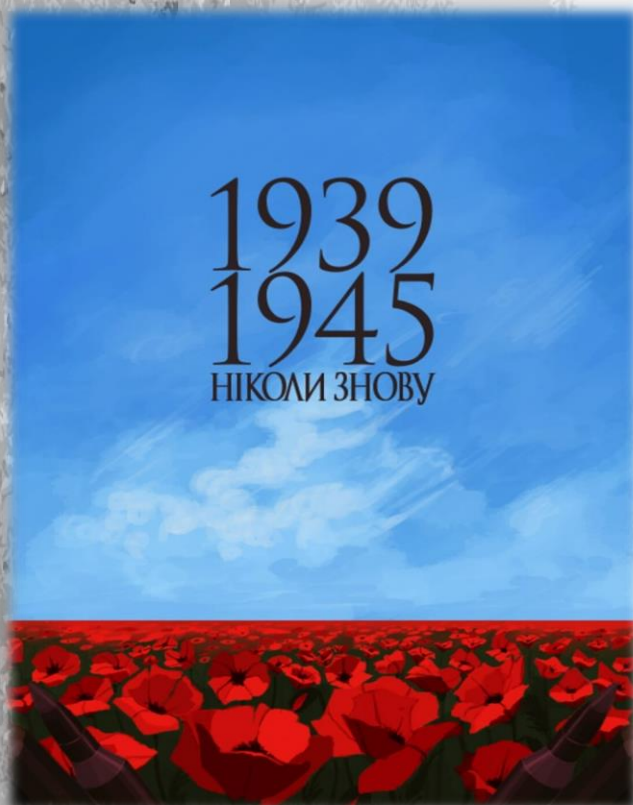
Роботи Сальнікової Ксенії